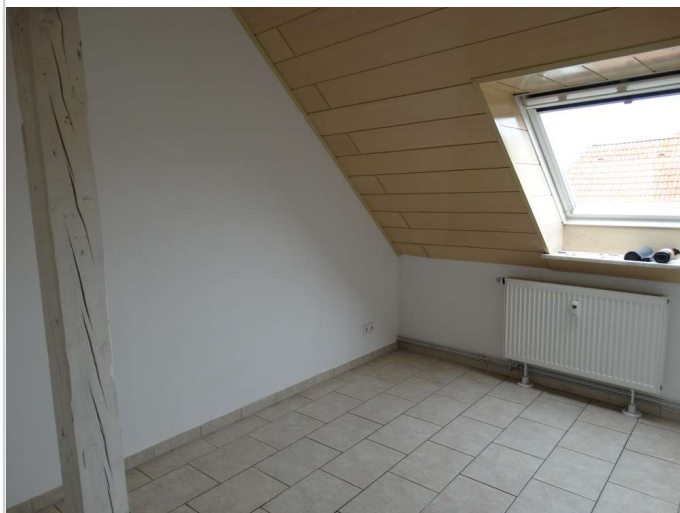
im 2. Schlafzimmer