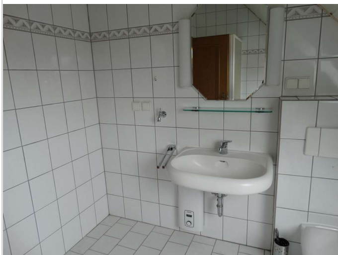
Bad mit Fenster Wanne + Dusche