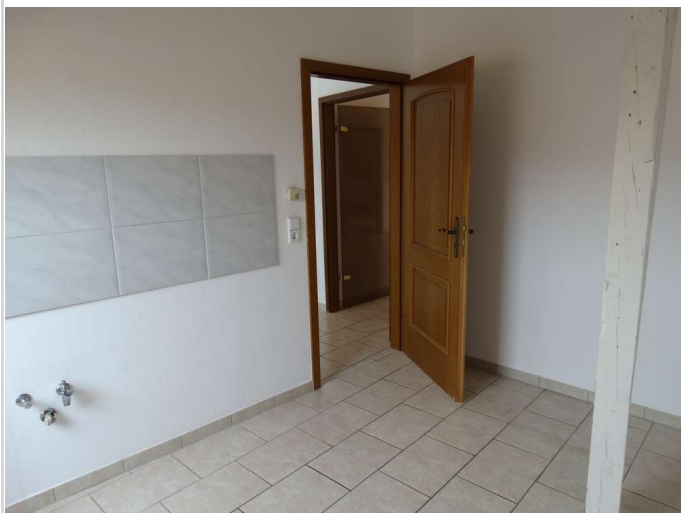
bitte die Küche mitbringen

Zimmer: 3,00 Wohnfläche ca.: 97,00 m 2 Kaltmiete: 700,00 EUR (zzgl. Nebenkosten) Gesamtmieta: 950,00 EUR