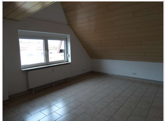
sehr großes Kinderzimmer