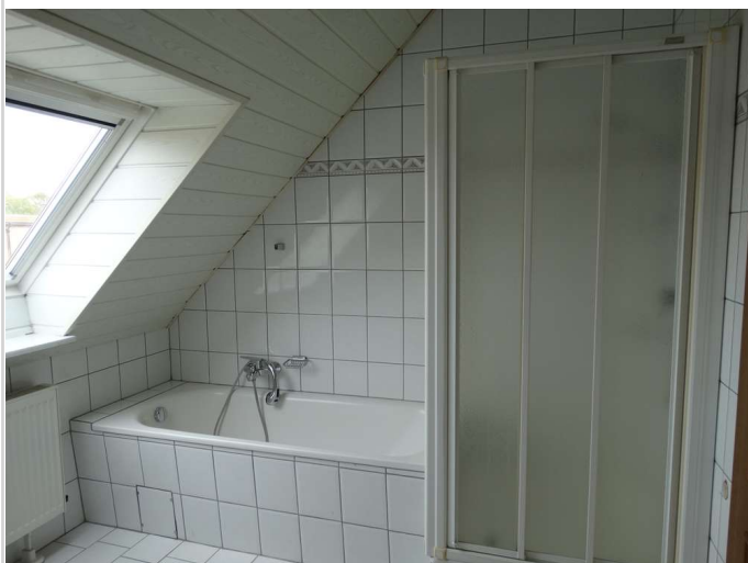
Bad mit Fenster Wanne + Dusche